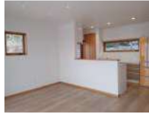
三原市糸崎一丁目 N邸