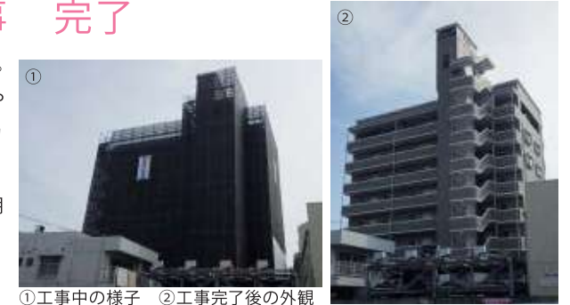
①工事中の様子 ②工事完了後の外観