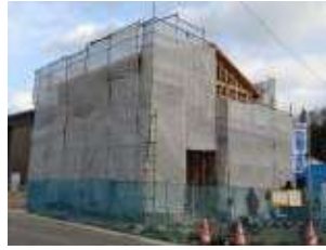
尾道市美ノ郷町 O邸