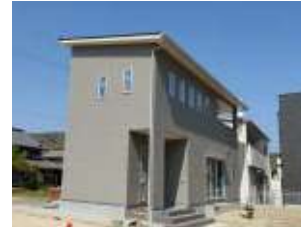
尾道市美ノ郷町 三成モデルハウス

《完成見学会開催決定！ in三成会場》 4月29日・30日・5月1日に、 「三成モデルハウス完成見学会」を開催します。 全日予約制です。 見学をご希望の方は、ホームページまたはお電話にて お申し付けください！ また、上記日程に限らず見学していただけますので、 弊社営業部までお気軽にお問い合わせください。 - フリーダイヤル 0120-41-3103 -