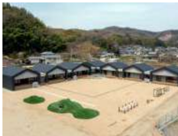
完成した園舎と園庭